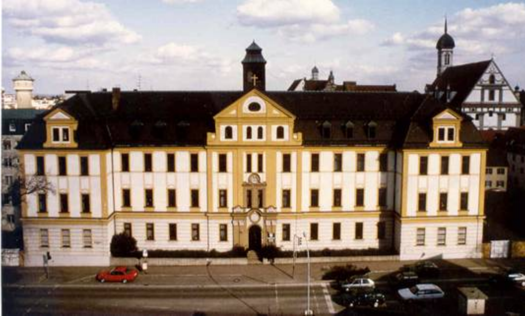
Hauptgebäude Regens Wagner Dillingen

Stundenthema: Menschen mit Behinderung in den Regens Wagner Einrichtungen „Regens Wagner heute“